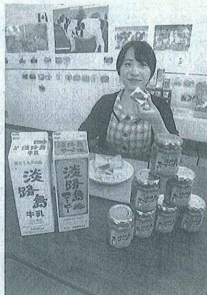
コーヒー牛乳をベースにした「淡路島コーヒージャム」(南あわじ市で)